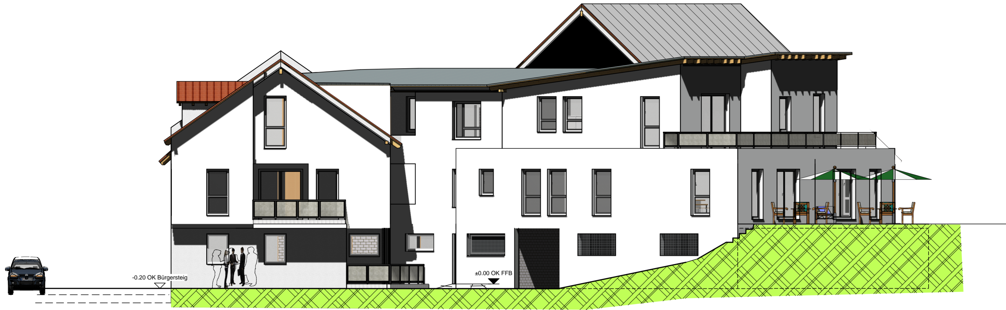
NORD - WEST ANSICHT , M. 1:100